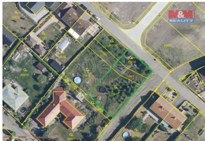
ÚZEMNÍ PLÁN HRUŠOVANY